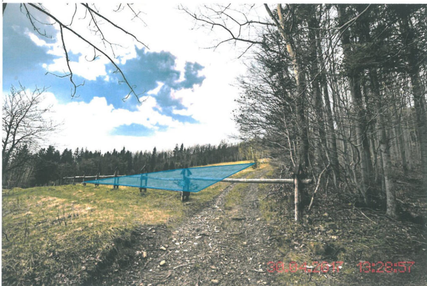
Fot.002 - Wizualizacja części powierzchni działki 9102/110 do przeklasyfikowania na cele zabudowy mieszkaniowej jednorodzinnej.