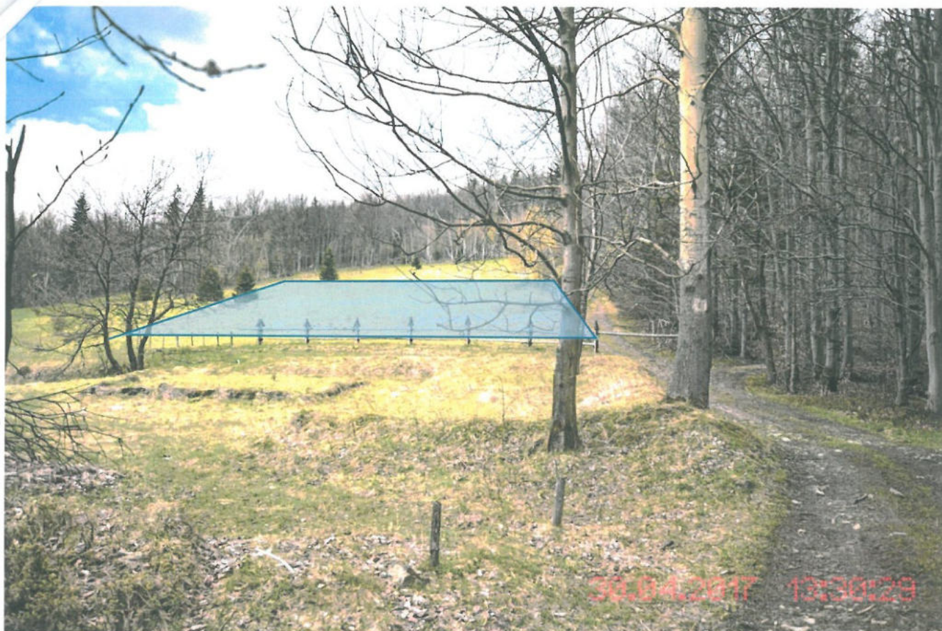
Fot.001 - Wizualizacja części powierzchni działki 9102/110 do przeklasyfikowania na cele zabudowy mieszkaniowej jednorodzinnej.