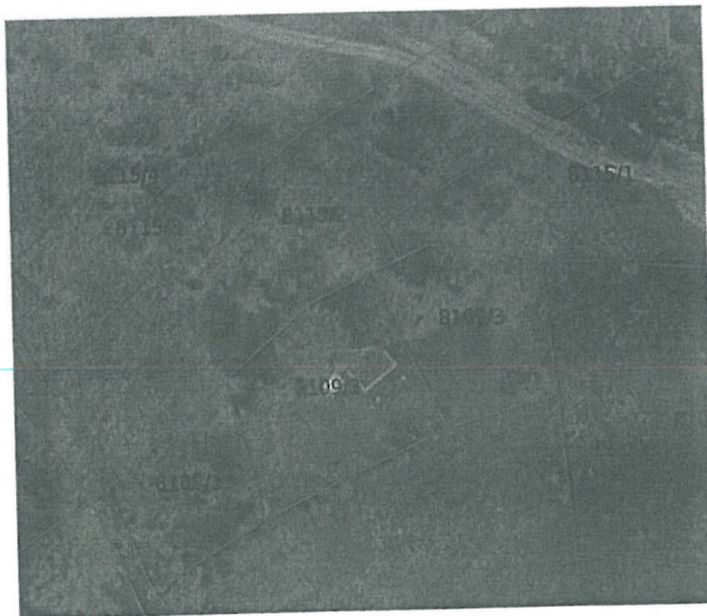
Rys. 2 – Położenie Nieruchomości wobec zabudowy na działce 8109/2