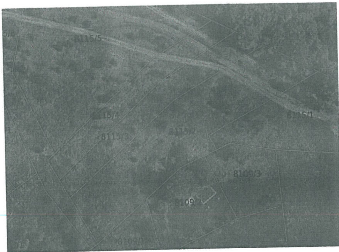
Rys. 1 Położenie Nieruchomości.