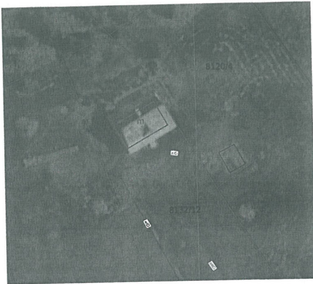
Rys. 3 Budynek na działce nr 8132/12