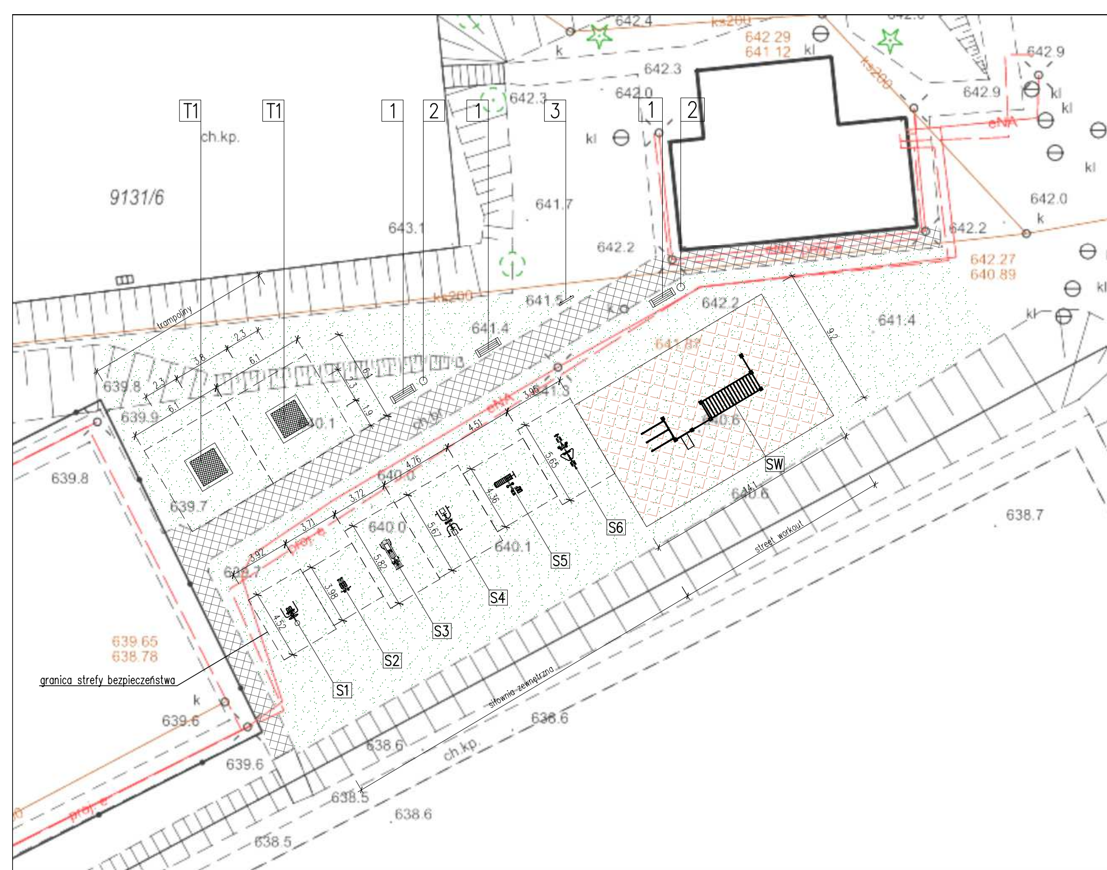
SW street workout