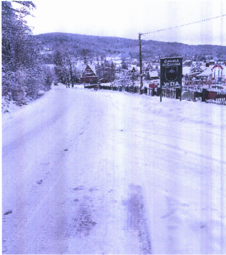
Zdjęcia z dnia 30 grudnia 2019.

Czy zostaną wyciągnięte konsekwencje oraz nałożone kary za nie wywiązywanie się z warunków umowy.